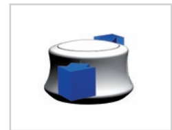
Przybliżenie / Oddalanie